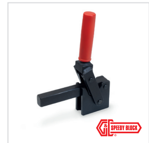
2 Form F massiver Spannarm