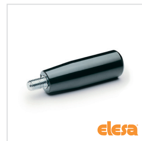
ELESA Original design I.280 p